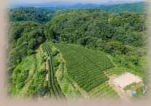
天空の茶畑