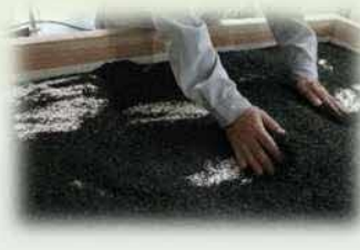
(ポイント2)